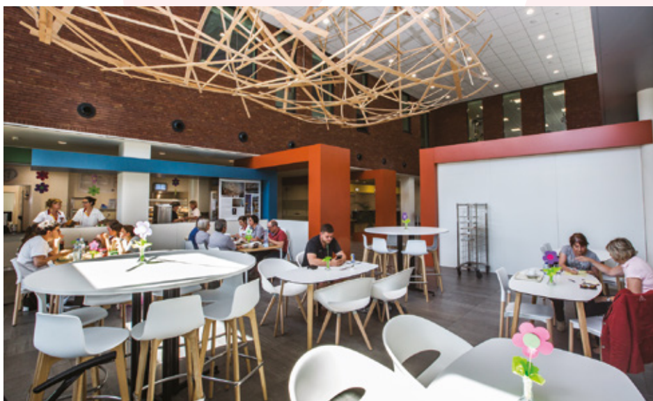
Campus Beveren beschikt over een gezellige cafetaria

De afdeling beschikt over een grote therapiezaal voor kinesitherapie en ergotherapie. Er zijn aparte lokalen voor logopedische en psychologische ondersteuning. Verder beschikken we ook over een ruime eetzaal waar patiënten die voldoende mobiel zijn 's middags samen eten. Vanuit beide afdelingen is er toegang tot een zonnig terras.